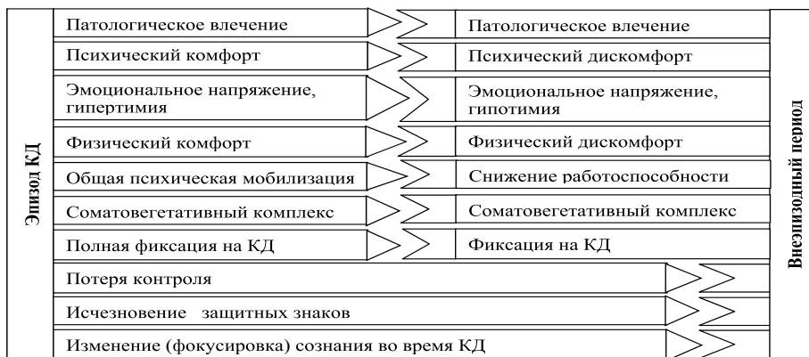
Рисунок 4.1. Соотношение проявлений эпизода и внеэпизодного периода у пациентов, страдающих ИЗ

Симптомы эпизода и внеэпизодного периода находились, по мнению авторов, в патогенетической взаимосвязи, что позволило расценить их интеграцию как синдром зависимости от КД (рис. 4.1).