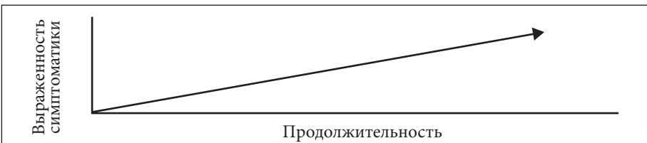
Рисунок 4.2. Перманентный тип течения

1. Перманентный тип течения представлял собой постепенное развитие с постоянным усложнением и прогрессированием (рис. 4.2).